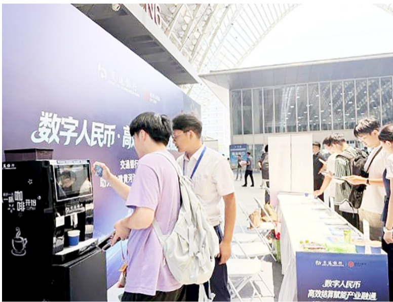
活动现场设置了0.01元数字人民币支付咖啡机互动体验区。

为加速数字人民币在大众消费场景的普及推广,博览会同步落地多类软钱包消费福利,全部优惠支持现场领取。所有完成实名登记的数字人民币新老用户,扫码即可领取满50元减10元专属支付红包;针对展会商贸采购交易场景,同步上线数字人民