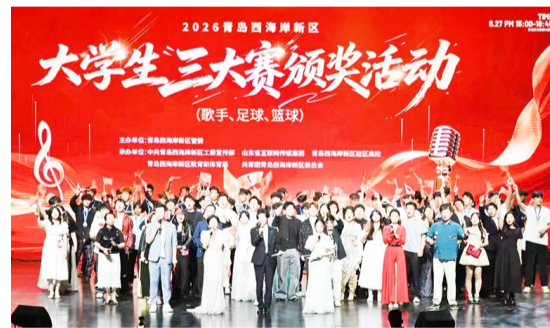
西海岸新区大学生“三大赛”活动现场。

早报6月29日讯 6月27日,2026西海岸新区大学生歌手大赛总决赛暨“三大赛”颁奖活动举行。来自不同高校的22名(组)大学生歌手站上梦想舞台迎来最终对决,同时,足球、篮球联赛的优胜队伍荣耀归来。