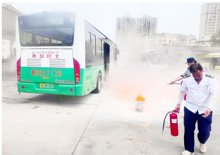
市南巴士各分公司开展专项演练。

6月29日,市南巴士一分公司开展“聚焦钥匙管控掩木 筑牢公交安全防线”专项演练,将演练维度拓展至“钥匙管控”与“掩木实操”双重环节。演练现场,一分公司安全人员首先重申车辆钥匙专人专管、离车即拔、交接留痕的硬性管理制度,强调钥匙失控即意味着车辆管控第一道关口的失守。