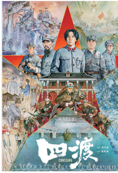
周星驰新片“弹性定档”