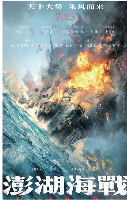
三国群雄与大圣争锋