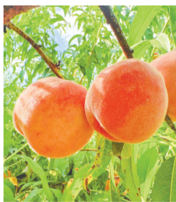
胶州蜜桃。 资料照片

栏窗口期,产销势头喜人。一粮一畜双丰收的良好态势,正是青岛市深耕质量兴农、品牌强农,扎实推进“三品一标”培育,做强全国名特优新农产品的生动缩影。“基地立足生物多样性发展,围绕种养循环、绿色低碳、微生物应用等方面持续完善自有标准体系,全力打造安全健康的高品质黑猪肉产品。近期200多头黑猪即将集中出栏,有了全国名特优新农产品这块金字招牌,我们的产品卖得更更有底气了。”平度黑猪肉生产基地相关负责人告诉记者。依托“国字号”的认证背书,平度农产品市场辨识度持续提高,有效放大产品品牌影响力,提升产品附加值与市场溢价,实实在在助力种养主体增收致富。