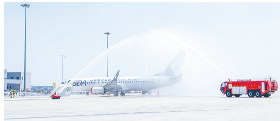
演练中,灭火救援、危化品处置等环节一一展开。

早报6月10日讯 为全面提升应急处置实战能力,6月10日,青岛胶东国际机场举办“航安2026”应急救援综合演练。本次演练由民航华东地区管理局、民航青岛监管局督导,青岛国际机场集团与山东航空青岛分公司联合举办,空管、机场公安、市消防、市急救、武警等单位参演,省、市相关行业主管部门及多家驻场、境外航司代表现场观摩指导。