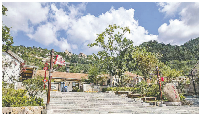
▲美丽的崂山旅游路在海山之间穿行。 资料照片