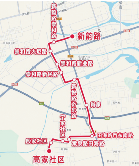
953路线路图。

早报6月2日讯 6月2日5时40分，青岛城运控股集团城阳巴士有限公司953路便民专线正式开通。该线路方便了城阳区红岛街道宁家社区、殷家社区、高家社区居民出行需求，同时填补了崇和路、田海路、漱泉路、迎鸥路部分路段公交线路盲区。