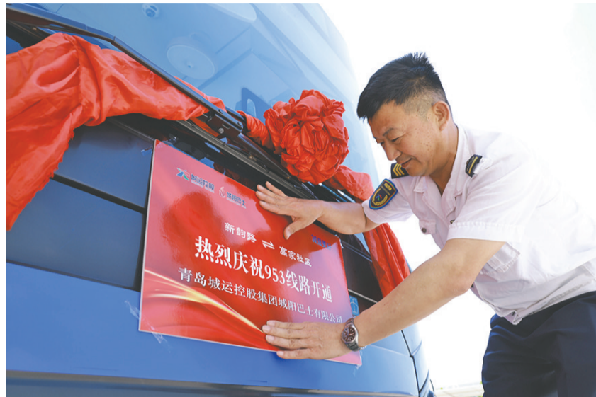
城阳巴士953路便民专线开通。

953路自新韵路发往高家社区，线路长度7千米，上行、下行各设12个站点。首末车时间为新韵路5:40—19:40，高家社区6:00—20:00，实行一小时一班定点发车。此次新增站点包括崇和路新业路、崇和路新民路、田海路杏东南路、高家社区。