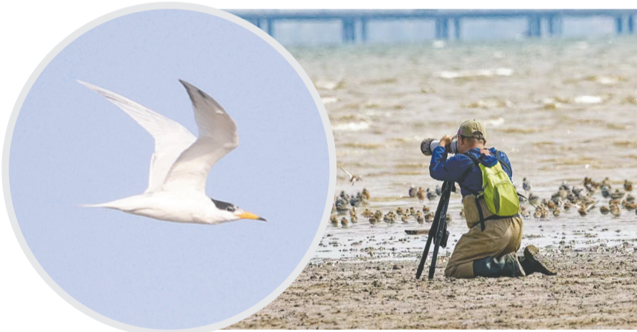
▲市观鸟协会在胶州湾实施鸟类监测。资料图片