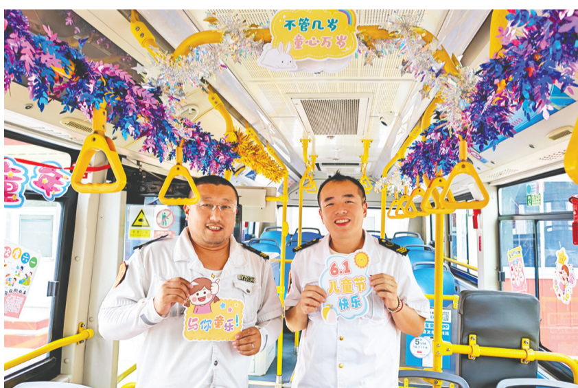
402路精心打造“六一童趣主题车厢”。

为给广大少年儿童送上温馨的节日祝福,市南巴士402路公交车精心打造“六一童趣主题车厢”,车厢内壁、扶手、车窗上都张贴了卡通萌趣贴纸与缤纷彩画,彩色飘带与童趣挂饰交织错落,让原本朴素的车厢焕然一新。公司还在主题车厢内设置免费糖果领取处,多款口味的糖果供孩子们免费品尝。同时,11路公交车也同步推出“心愿寄语·童趣主题车厢”,色彩斑斓的花穗缠绕在车厢扶手上,明快