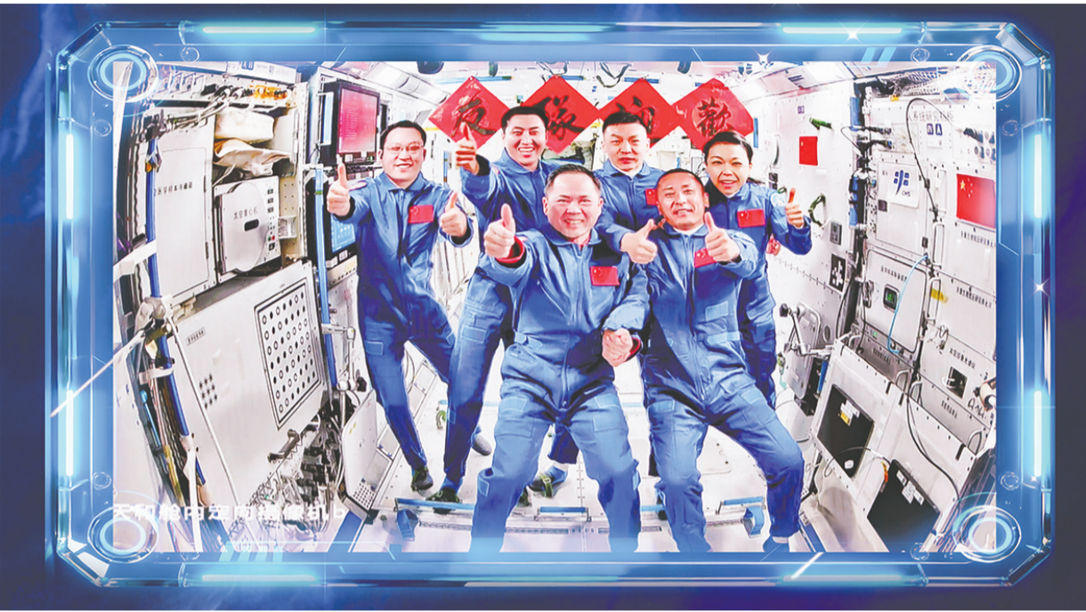
两个航天员乘组拍下“全家福”，共同向牵挂他们的全国人民报平安。

神舟二十三号航天员乘组25日顺利进驻“天宫”，中国航天员完成第8次“太空会师”。