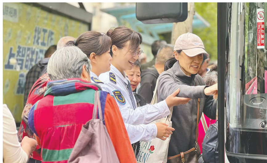
364路用“三多三防”守护乘客出行路。

考虑到老年乘客腿脚不便、常携带小推车出行的特点,早高峰时段专门调配了10.5米中车新能源车投入运营。该