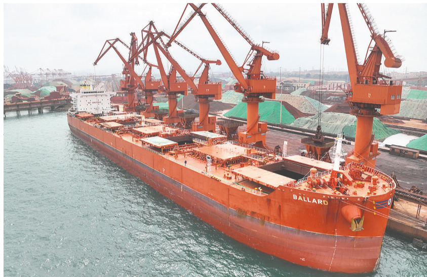
山东港口青岛港首次接卸超大型CABU特种船。