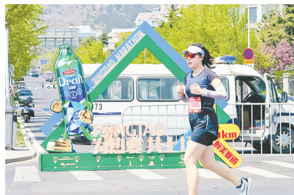
青岛啤酒亮相2026年青岛马拉松。

早报5月11日讯 截至2026年4月30日,青岛辖区65家境内上市公司均已按期披露2025年年度报告和2026年一季报。面对复杂严峻的国内外环境,青岛上市公司呈现出较强韧性,全年合计实现营业收入6616亿元,同比增长1.87%,高于A股整体增速;实现归属母公司股东净利润503.63亿元,同比增长8.74%,领先A股整体水平。