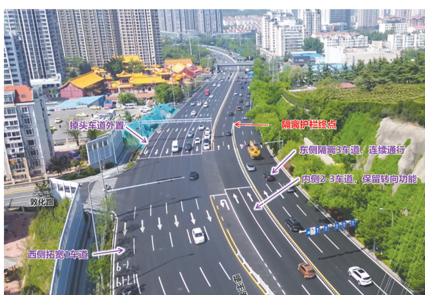
福州路敦化路路口交通优化示意图。

造后,南向北直行车辆在延吉路、敦化路路口不受信号控制,可连续通行。为避免非机动车变换车道时与直行机动车产生交叉隐患,对延吉路和敦化路路口及周边通行路径实施控制。