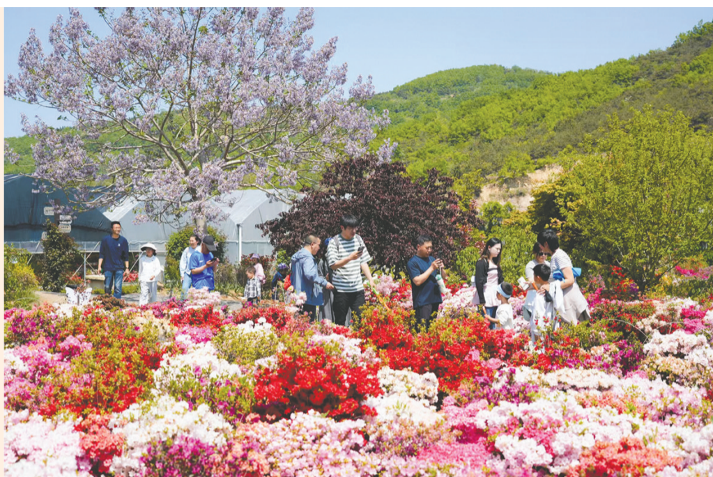
游客在西海岸新区铁山街道杨家山里片区无比方花园拍照打卡。

五一假期,青岛乡村交出了一份令人惊艳的“五一答卷”!全市各级乡村振兴片区火力全开,以赏花踏青、非遗研学、田间咖啡、山海康养等多元场景为底色,推出140余场主题文旅活动,用蓬勃生机勾勒出“诗与远方”的乡村画卷。据统计,五一假期期间各级片区累计接待游客95.1万人次,实现农文旅综合收入7991.5万元,较去年同期分别增长28.3%与31.2%,为假日经济注入了鲜活的乡村力量。这份亮眼成绩的背后,是青岛乡村游从“农家乐”到“小而美”的华丽蜕变。