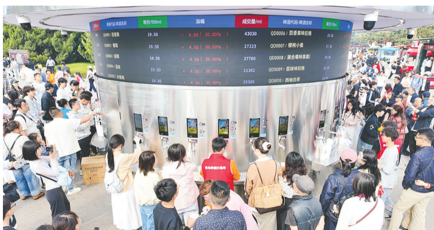
太平路与中山路交叉口的啤酒交易中心吸引游客。