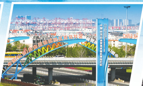
青岛自贸片区城市风貌。