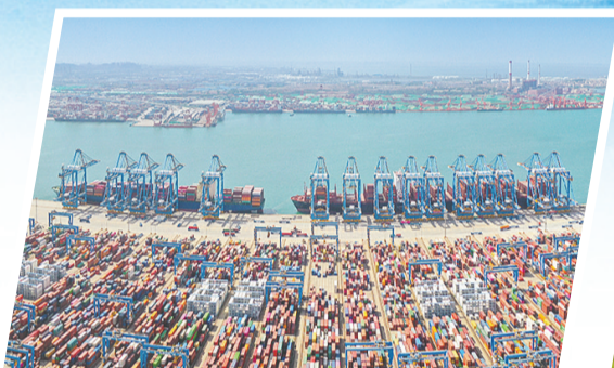
山东港口青岛港前湾港区。