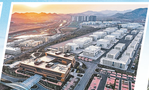
青岛东方影都影视产业园。