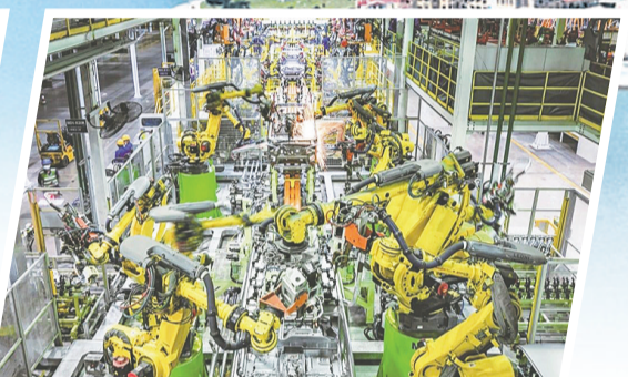
上汽通用五菱青岛基地。