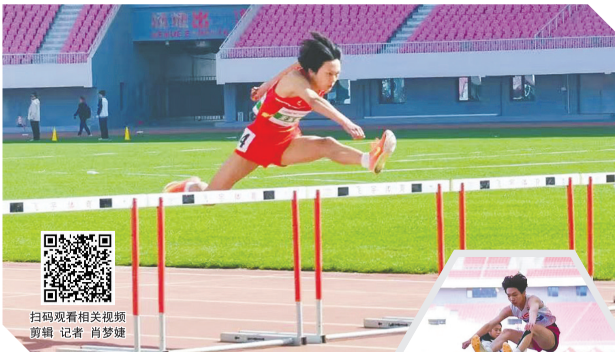
扫码观看相关视频 剪辑 记者 肖梦婕