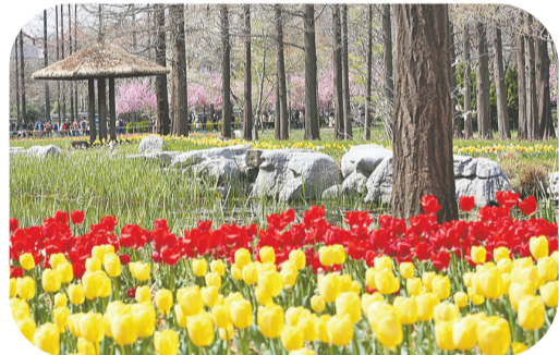
郁金香把中山公园装扮成“莫奈花园”。