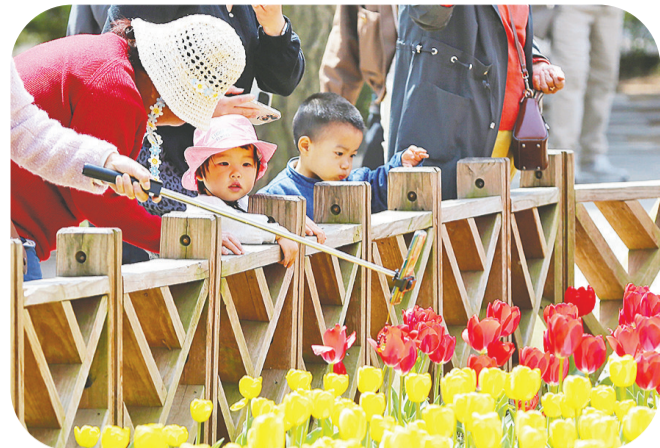
郁金香吸引小朋友们的目光。