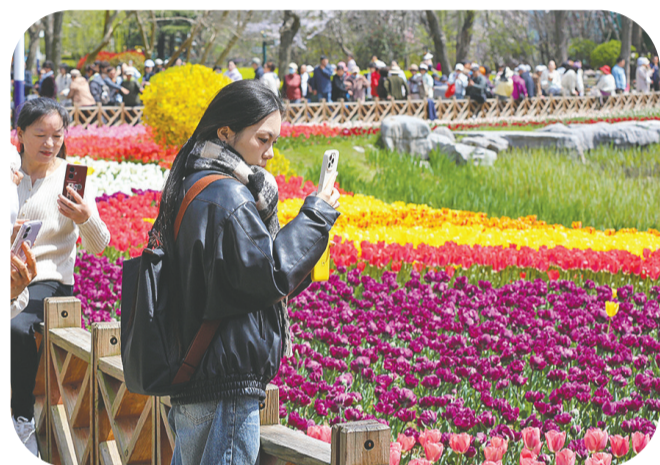
游人在花海中记录美好。