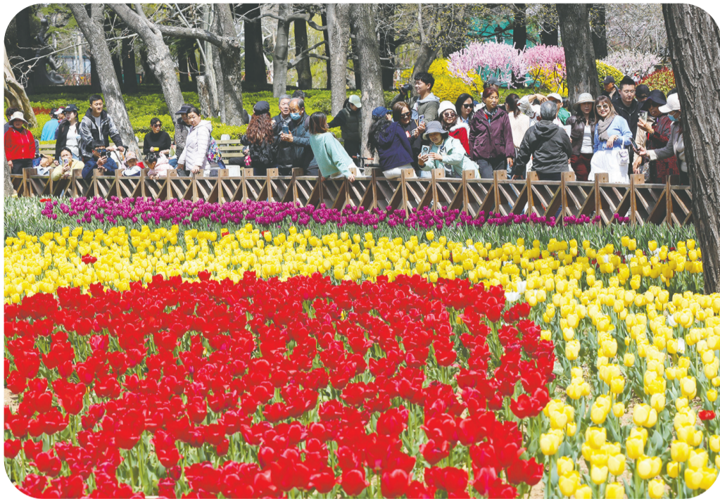
五颜六色的郁金香绚丽绽放,吸引市民游客观赏。

早报4月10日讯 芳菲四月,郁金香总会如约绽放。一朵朵郁金香犹如披上温润柔软的五彩新衣,市民游客目光所及之处尽是一幅幅生机勃勃、惹人喜爱的“画”。近日,岛城天气回暖,中山公园的郁金香迎来最佳观赏期。