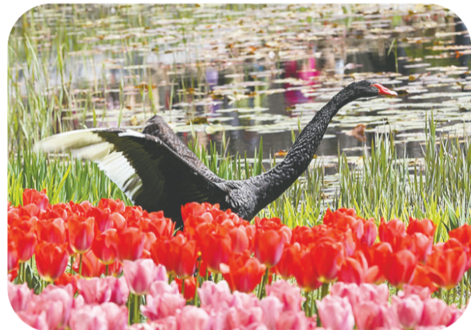
黑天鹅在郁金香旁“起舞”。