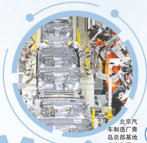
北京汽车制造厂青岛总部基地生产车间。