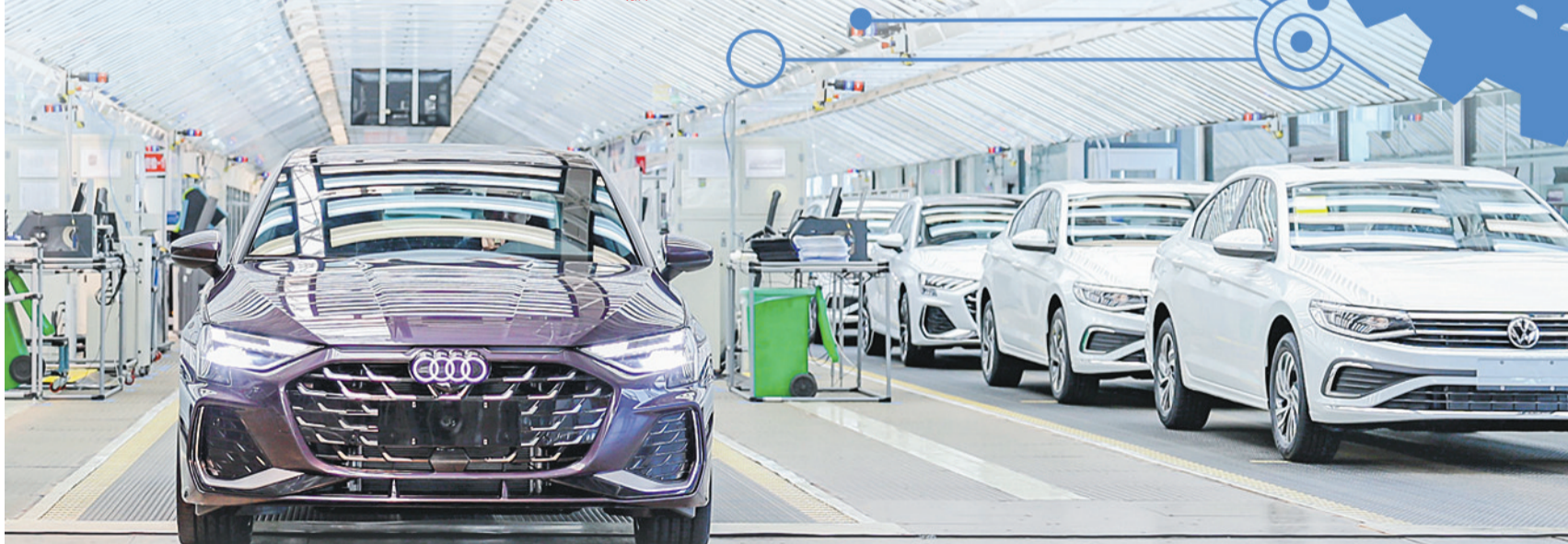
一汽-大众华东基地生产车间。