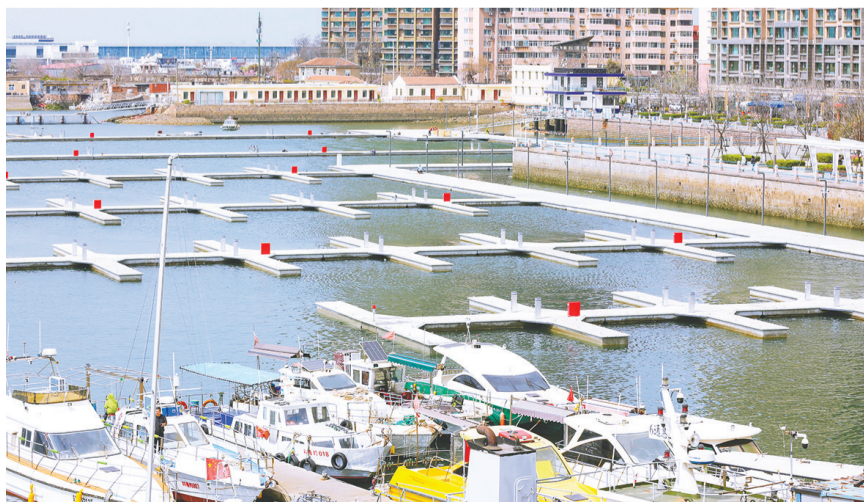
青岛小港湾休闲海钓基地项目已完工。

小港湾一带,老青岛人称之为“小港儿”,或叫“后海沿”。作为北方优质钓场,小港湾年均适钓期长达 280 天,渔产丰富,小港湾坐拥带鱼、鲈鱼等丰富渔获资源。“放眼全国海钓基地,基本在县级市或者郊外。小港湾海钓码头建成后,将是全国稀有的位于主城核心区的海钓综合体,且毗邻青岛地铁 2 号线、‘世界之眼’(海上旅游集散中心)、青岛邮轮母港客运中心等交通配套,能让广大钓友