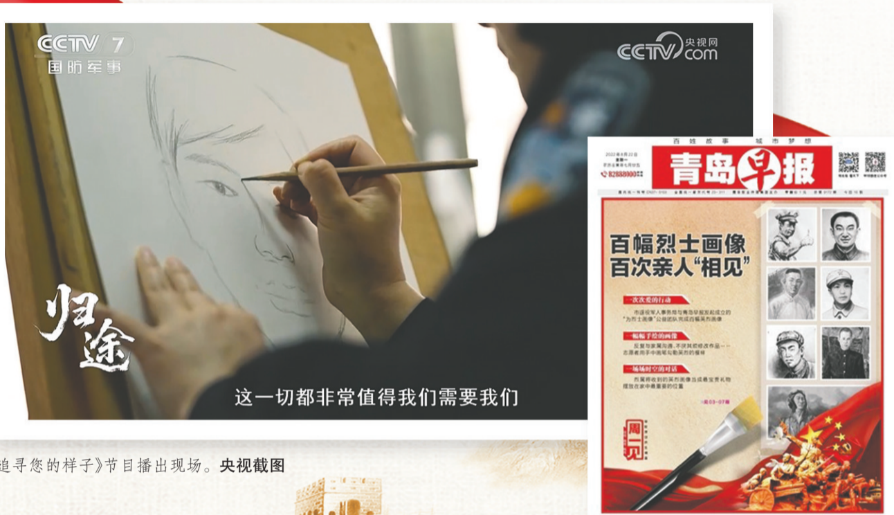
《追寻您的样子》节目播出现场。