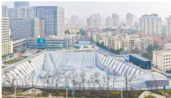
基坑气膜拆除中。

早报4月7日讯 4月7日,青岛市市立医院东院区三期改扩建项目基坑施工防护气膜拆除工作结束,拆除用时5天。作为我市首例基坑气膜工程,自2025年10月建成投用以来,圆满完成基坑施工“护航”任务,实现“全封闭、零扰动、高效能”的绿色施工目标,其成功应用为全市同类项目绿色施工管理提供了可复制、可推广的实践经验。