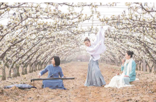
身着古装的游客在梨花下起舞。资料照片

早报4月7日讯 春风送暖,梨花竞放。4月11日,“醉美梨花海·相约在日庄”莱西市第十一届梨花节将拉开帷幕。莱西市日庄镇3万亩梨园届时将迎来盛花期,以洁白花海为媒,邀请八方来客共赴一场“春日限定版”的浪漫之约。