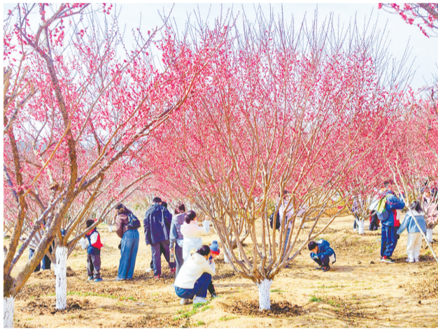
花语人间景区吸引游客前来游玩赏花。