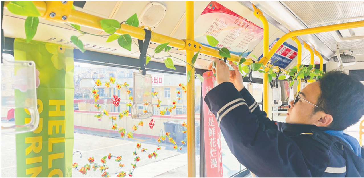
公交驾驶员打造植树节主题车厢。