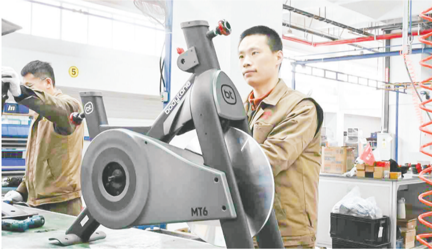
青岛英派斯健康科技股份有限公司生产车间里，工人在检测产品。

“今年开工早、订单足，我们从管理层到一线员工，全部下沉车间，确保生产不停顿、订单不延误。”即发集团华诺针