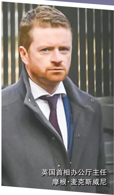
英国首相办公厅主任 摩根·麦克斯威尼

挪威外交部8日说,已启动对挪威驻约旦及伊拉克大使莫娜·尤尔的调查。这名资深外交官因与已故美国富商爱泼斯坦有关联而辞职。同日,英国首相办公厅主任摩根·麦克斯威尼8日因英国前驻美国大使彼得·曼德尔森涉爱泼斯坦案引咎辞职。