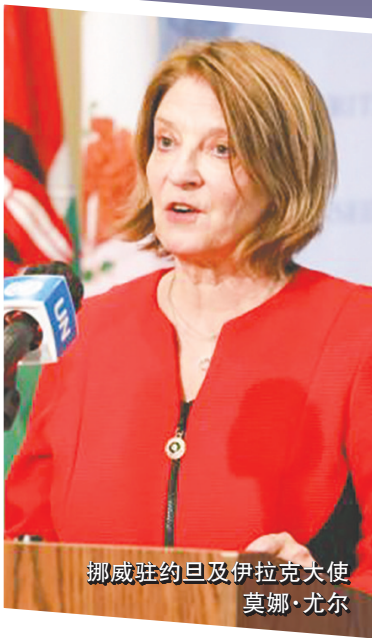
挪威驻约旦及伊拉克大使 莫娜·尤尔

在最新公开的爱泼斯坦案相关文件中,雅克·朗的名字被提及逾670次。文件显示,两人曾在2012年至