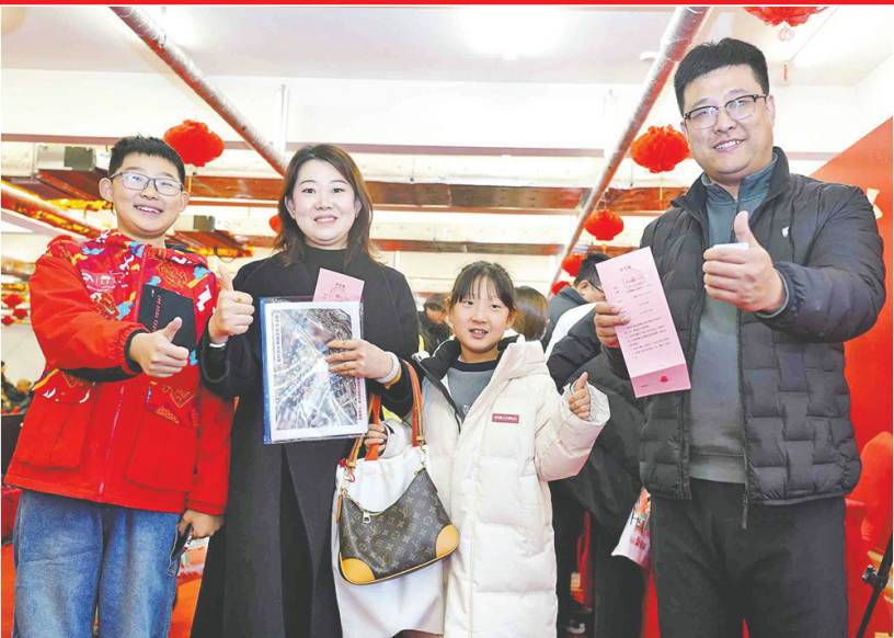
居民回迁喜气洋洋。