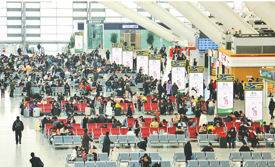
2025年春运期间青岛北站客流量颇大。资料照片