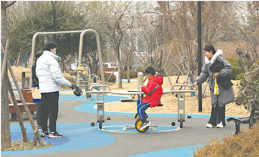
劲松五路口袋公园正式完工开放。

早报1月14日讯 近日,崂山区劲松五路口袋公园绿地整治工程顺利完工,正式向市民开放。这块位于劲松五路(辽阳东路以南、同兴路以北段)东侧的市政绿地,历经升级改造,从设施老化、绿地裸露的旧场地,蜕变为融合生态、运动、休闲于一体的全龄“时光会客厅”,为周边居民送上家门口的绿色福祉。