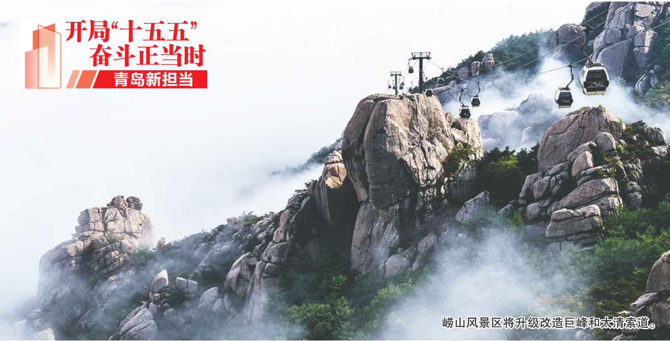
崂山风景区将升级改造巨峰和太清索道。

1月13日，崂山区政府新闻办举行主题新闻发布会，介绍崂山风景区发展情况，青岛早报记者从会上获悉，2025年，崂山风景区接待游客量累计658.1万人次，同比增长5.6%，购票游客量累计388.8万人次，同比增长7.6%。放眼未来，“十五五”时期，崂山风景区聚焦打造“山海特色世界旅游目的地”和“优秀传统文化传承发展片区”目标，凝心聚力，奋力开拓，推动景区各项工作迈上新台阶。