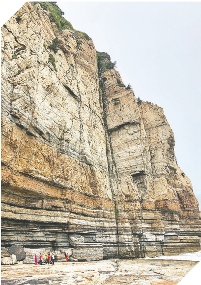
八仙墩景区将有序开放。

寿”的双节联动IP。聚焦“文旅+婚恋”产业融合发展，围绕“空中鹊桥”地标性爱情文化核心景观，进一步创新婚恋旅游体验场景，叫响“海誓山盟·爱在崂山”婚恋品牌，助力青岛甜蜜经济发展。大力发展“文旅+科技”“文旅+影视”，发挥崂山风景区全市影视拍摄基地作用，引进一批影视剧、电影、短剧到崂山拍摄；运用虚拟现实、数字交互等前沿技术，策划推出崂山主题动漫、动画，持续拓展崂山文化品牌影响力。