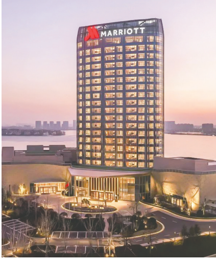
青岛胶州万豪酒店。