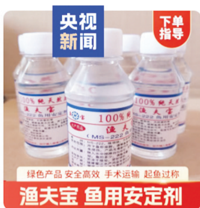
绿色产品 安全高效 手术运输 起鱼过称 渔夫宝 鱼用安定剂

食品工程博士、科普作家云无心介绍,“丁香树、丁香花的油脂里就有丁香酚,丁香酚提取出来之后,在食品