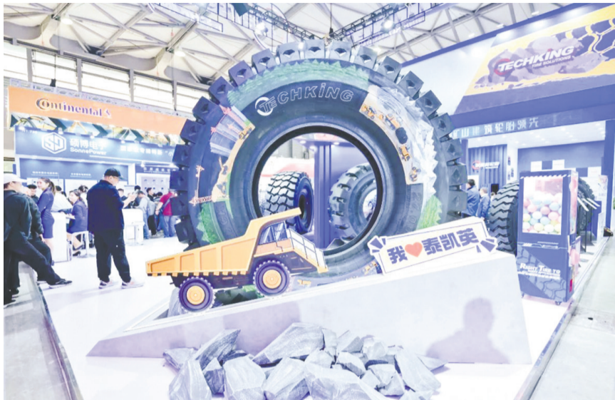
泰凯英推出的适用于矿山、建筑等领域的专用轮胎。

据了解,泰凯英成立于2007年,是一家以技术创新为驱动,聚焦于全球矿业及建筑业轮胎市场,专业从事矿山及建筑轮胎的设计、研发、销售与服务的企