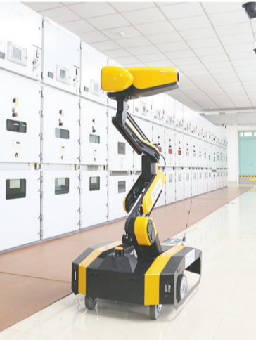
在供电设备间,智能机器人正在巡检。