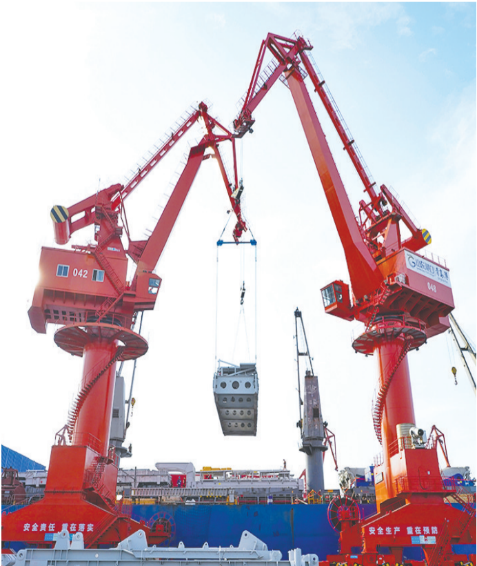
在大港码头,两台门机配合进行装船作业。