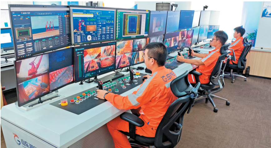
在矿石码头,工人们正通过远程操控进行卸船作业。

当前往共建“一带一路”国家的船舶在这里装卸货物,当“中国制造”从这里扬帆出海,当国家、省、市重点项目蹄疾步稳建设,青岛港劳动者的身影早已融进国家战略的宏伟蓝图中。满岸的奋斗热潮,是生产的火热图景,更是新时代产业工人对党和国家的赤诚告白。