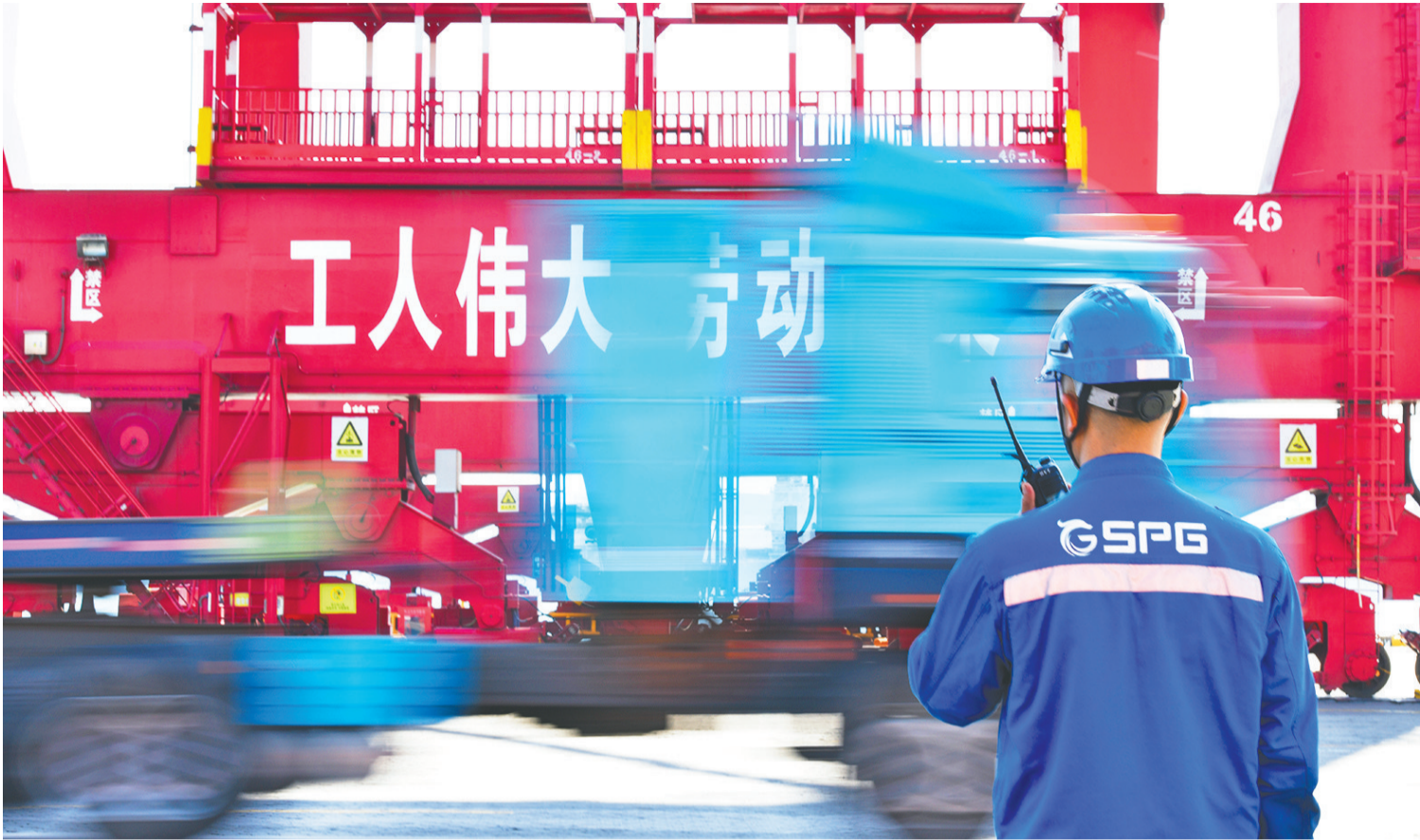
在前湾集装箱码头,现场管理人员正在指挥码头生产作业。

金秋的风,拂过飘扬的五星红旗,也吹拂在每一位坚守岗位的劳动者身上。在山东港口青岛港各大码头现场,机械设备满线运转,生产作业24小时不停,无数职工坚守岗位,用佳绩诠释“过节”与“大干”的交响、“小家”与“大国”的守望。