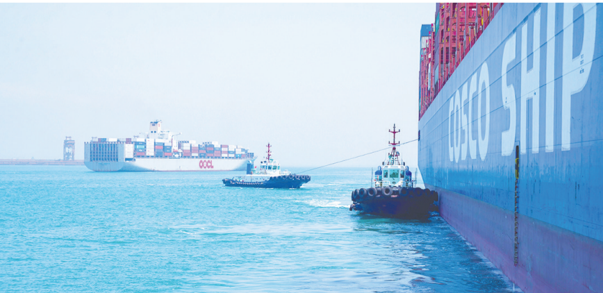
在前湾港区,港作拖轮正在协助巨轮靠港作业。