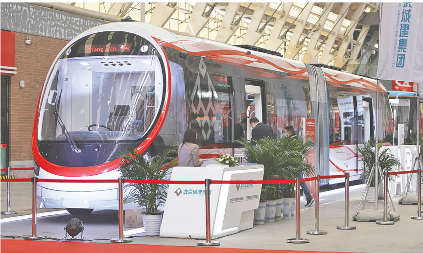
2023年北京-青岛轨道展上展出的新型列车。资料照片

展会规划超60000平方米展示空间,从城轨设计咨询、工程建设、装备制造,到运营维护、安全生产,再到新增的“轨道交通个体防护装备馆”,实现产业链上下游无缝衔接。行业众多龙头企业将携新一代“黑科技”参展,