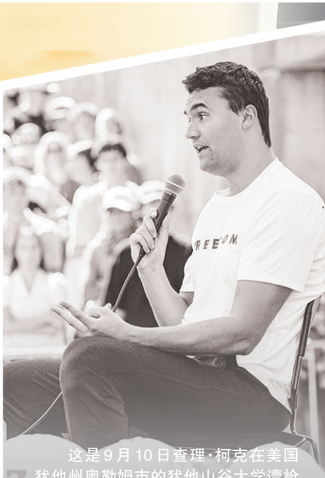
这是9月10日查理·柯克在美国犹他州奥勒姆市的犹他山谷大学遭枪击前发表演讲。

据美国全国广播公司报道,事件还引发了国会山的“震动”。美两党议员纷纷表达对自身安全的担忧,并称要采取更严格的安保措施。据报道,部分议员将公开活动移至室内或直接取消,多名议员表示近期将避免举行大型公开活动,仅限小规模私人会面。