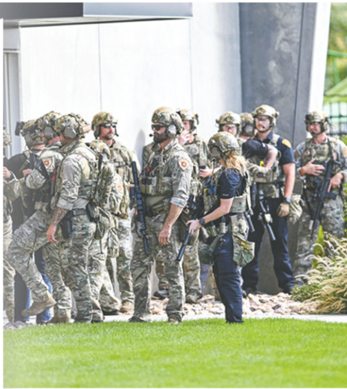
9月10日,在美国犹他山谷大学,执法人员准备清查一栋建筑。

8月21日,鲁比奥以“危及美国民众生命安全、损害美国卡车司机生计”为由,宣布停止发放商用卡车移民司机的工作签证,这一变更即日生效。