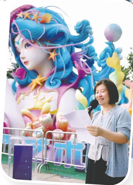
组图:青岛39中师生点灯送祝福。

一朝沐杏雨，一生念师恩。为庆祝全国第41个教师节，9月10日，青岛39中师生来到2025年“青岛之夏”艺术灯会，为岛城所有坚守育人一线的教育工作者点灯。