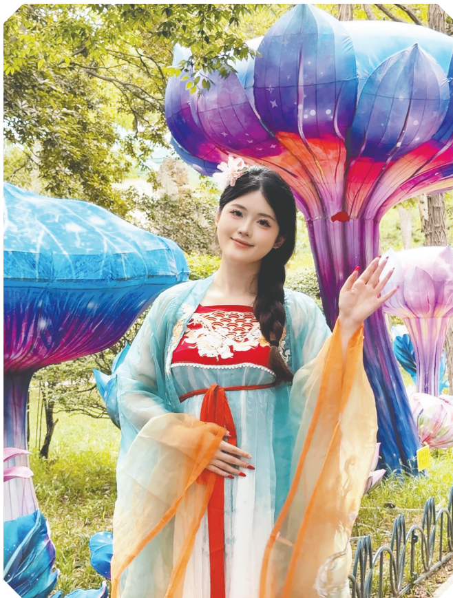
白天在灯组前打卡轻松“出片”。

工作人员介绍，本次幻境游园会具备独特的打卡优势，成为白天逛灯会的另一大亮点。步入园区的市民和游客，最先感受到的是一份沁人心脾的清凉。空气中弥漫着细密的水雾，这是园区精心设置的雾森装置。水雾并非简单地用来降温，它更是这场白天逛灯会的天然滤镜。当雾森与灯组、绿植交织，光影在