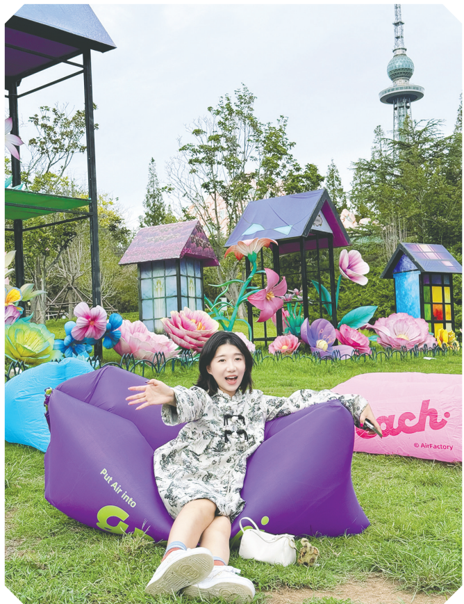
躺在园区沙发上体验“慢生活”。

售票地点：中山公园樱花路与雪松路交叉口（灯会樱花路主门售票厅）；票务服务咨询电话：0532-82888000。温馨提示：别忘了带上抵达青岛的登机牌和身份证，来线下售票点解锁专属优惠。