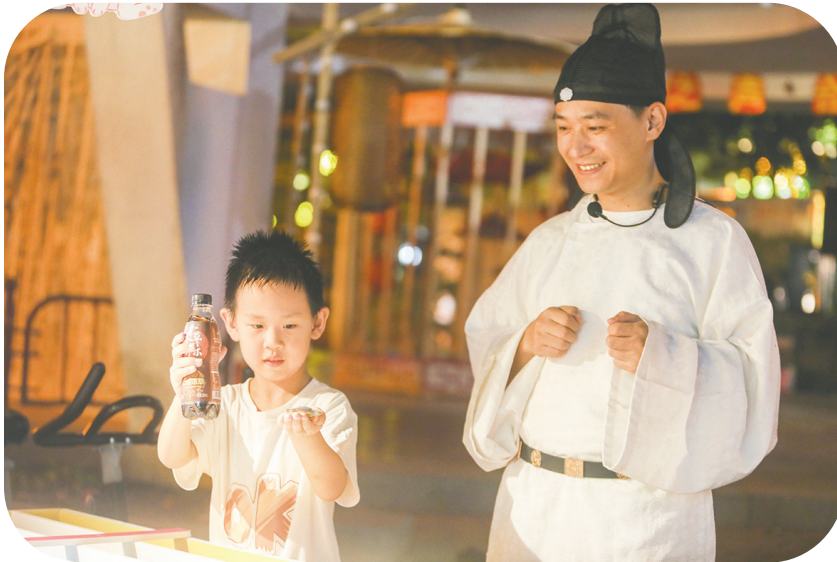
一位小朋友与李白扮演者玩游戏赢得奖品。