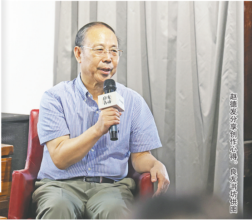
赵德发分享创作心得。

早报9月7日讯 根据赵德发长篇小说《缱绻与决绝》改编的电视剧《生万物》，在央视热播后成为2025年度的现象级爆款，也让这位笔耕不辍、创作力旺盛的作家再次成为公众关注的焦点。近日，赵德发最新长篇小说《大海风》由作家出版社正式出版。9月6日下午，作为青岛文学馆开馆十周年暨全国作家交流系列活动的首场，“《大海风》和当代文学形象的现代化再造——赵德发新作研讨会”在青岛文学馆成功举办。作家赵德发、本书责任编辑兴安与多位学界嘉宾齐聚一堂，共同探讨《大海风》历史叙事中的当代精神，挖掘海洋文明与现代性之间的深刻联系。