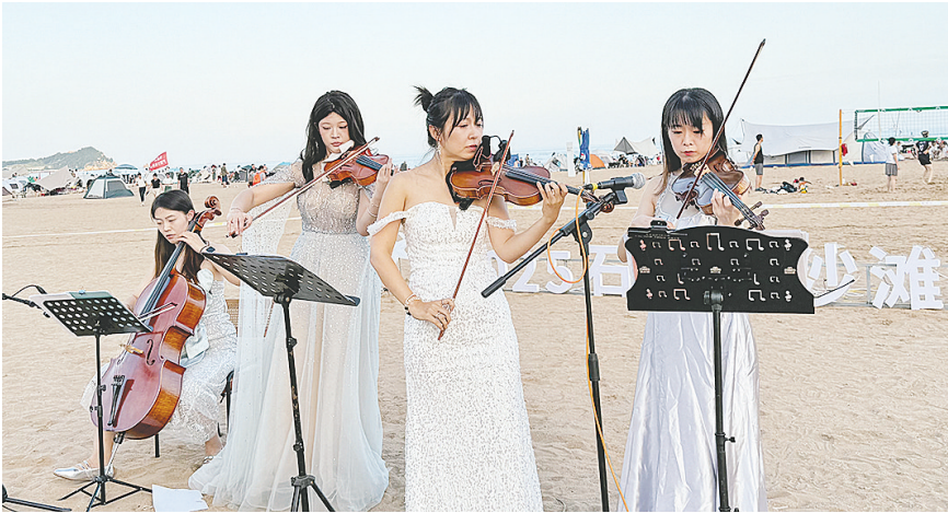
格斯乐团的演奏带来跨越时空的音乐对话。

琴独奏以极具爆发力的演绎惊艳全场。邦德乐队《Viva》激情四射，演奏者以富有张力的舞台表现力和精湛的技法令观众惊叹不已；迈克尔·杰克逊经典之作