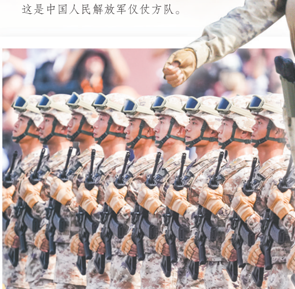
这是徒步方队接受检阅。