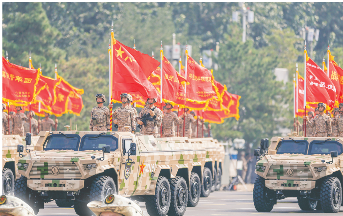
这是战旗方队接受检阅。