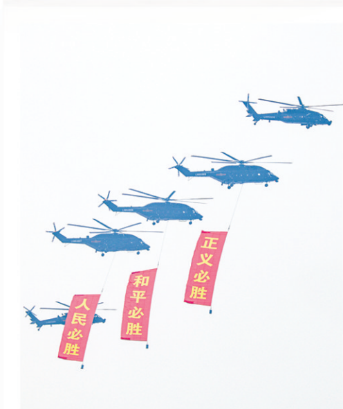
这是空中护旗梯队接受检阅。