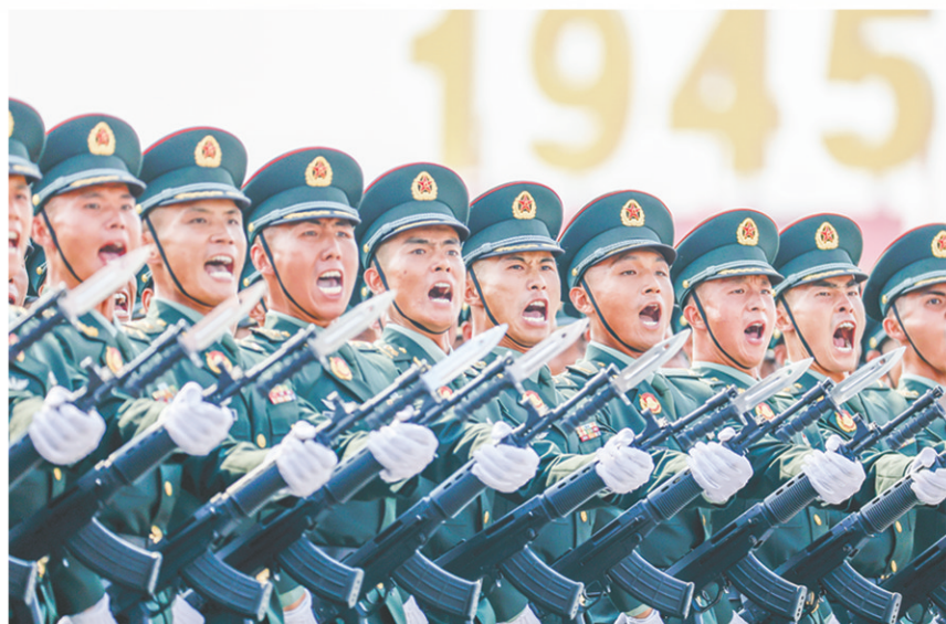
这是陆军方队接受检阅。