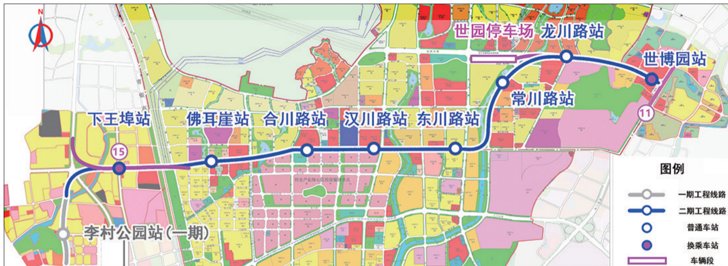
地铁2号线二期工程线路示意图。

8月26日,伴随“铁龙八号”盾构刀盘破岩而出,青岛地铁2号线二期工程迎来里程碑式突破,李村公园站至下王埠站区间(以下简称“李王区间”)顺利贯通,青岛地铁2号线二期工程历时两年十个月攻坚,实现全线洞通,为2026年通车奠定了基础。这也是青岛地铁三期工程首条洞通线路。