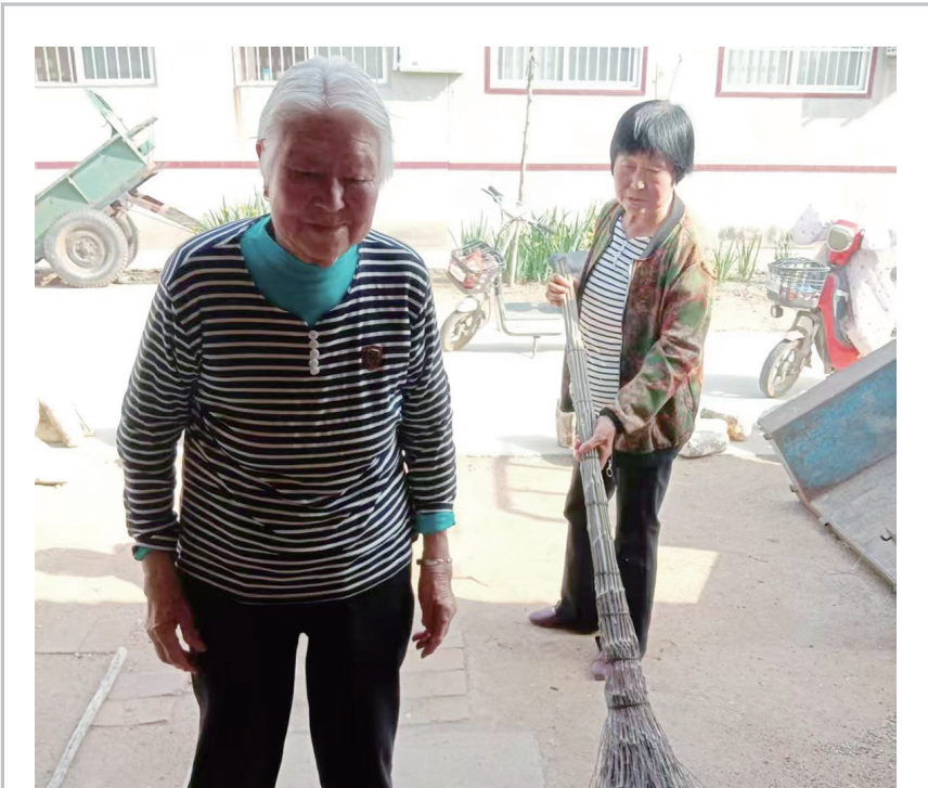
莱西市河头店镇希望新村实施互助养老,低龄老人帮扶高龄老人。

记者了解到,村里60周岁以上老年人有261人,占全村人口的28.2%;80周岁以上高龄老人达47人,占全村人口的5.1%,独居、空巢老人占在村居住老人的比例超过40%。自村里成立“银龄精准结对帮扶组”后,高龄老人每天都能迎来低龄志愿者上门探望,这种“低龄助高龄”互助养老体系提供精准结对服务,以“两人帮一人”为原则,组织身体健康、相对年轻的低龄老人(50岁