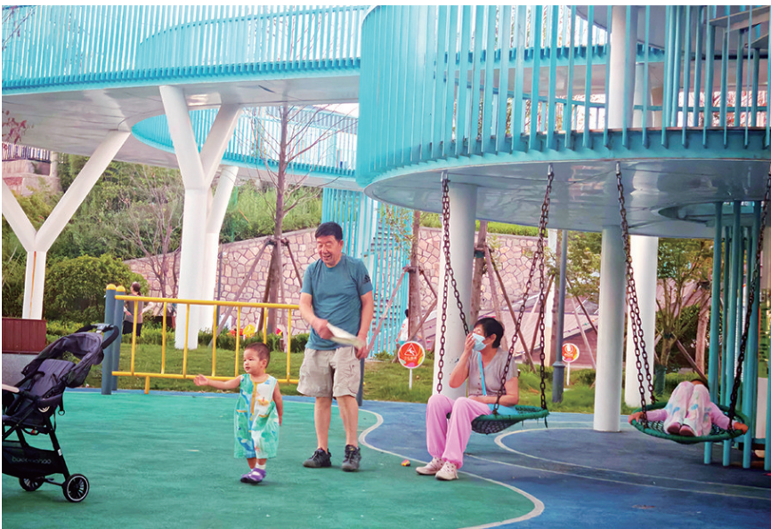
深圳路体育公园,老人正在“遛娃”。

除了商场,很多全龄公园也是老人们“遛娃”的好去处。青岛市多处公园基础设施建设日益完善,越发智能。齐鲁