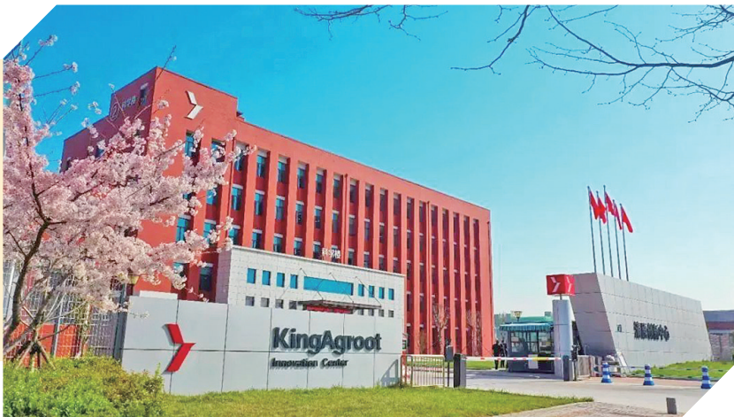
青岛清原作物科学集团有限公司。本组照片由青岛自贸片区提供

早报7月25日讯 近日,长城战略咨询发布《GEI中国独角兽企业研究报告2025》,青岛市共有10家企业上榜独角兽企业名单。位于青岛自贸片区的卡奥斯工业智能研究院(青岛)有限公司、青岛清原作物科学集团有限公司两家企业成功上榜。