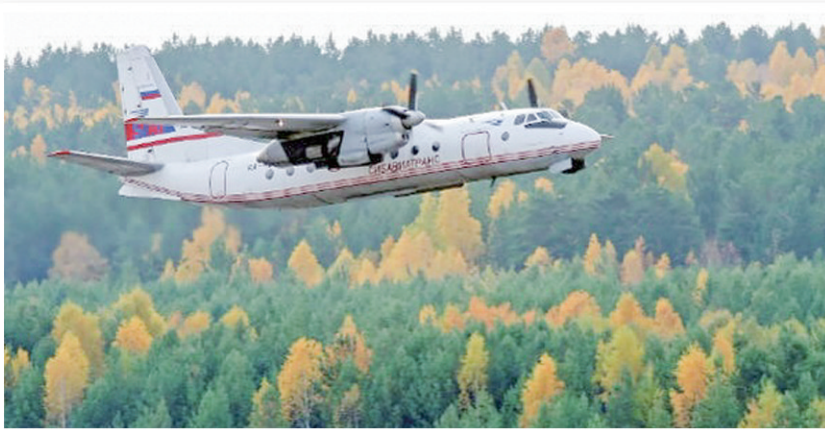
安-24客机的资料图片。

俄总统新闻秘书佩斯科夫当天对媒体表示,总统普京已获悉安-24客机坠毁的消息。俄总理米舒斯京通过社交媒体宣布,已成立由交通部长尼基京负责的政府委员会,处理空难善后工作。