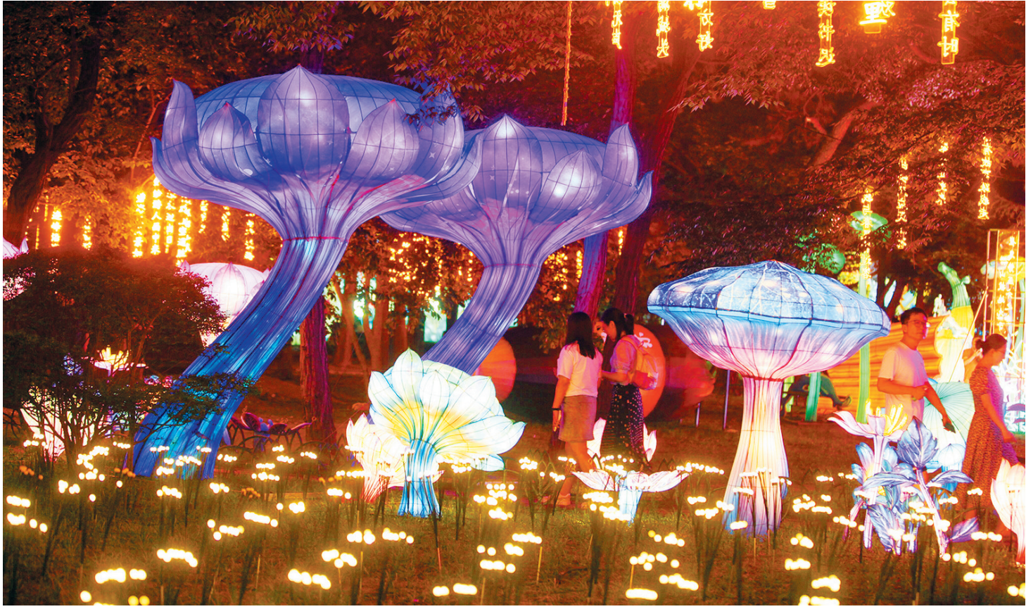
流光溢彩的《微观世界》灯组赢得了游客的赞叹。

2025年“青岛之夏”艺术灯会昨开幕 市民和游客排队入园 每个灯组前都围满了打卡拍照的人