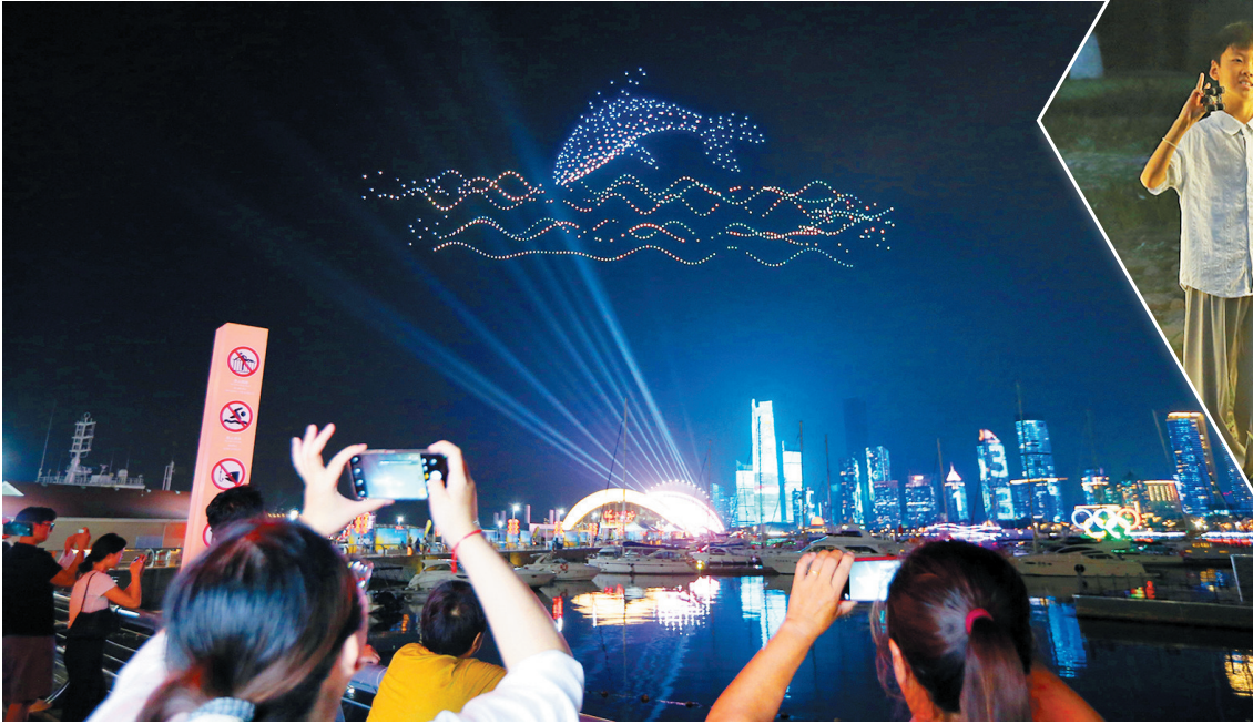
无人机在夜空中排列出鲸鱼图案。

“青岛人夏天最喜欢喝啤酒、吃蛤蜊、洗海澡,这个‘三件套’今年夏天要加新内容了。”住在闽江路的钟先生接受记者采访时说,这次灯会举办得太及时了,消夏“三件套”中加上逛灯会,以后在青岛就要玩转“四件套”。