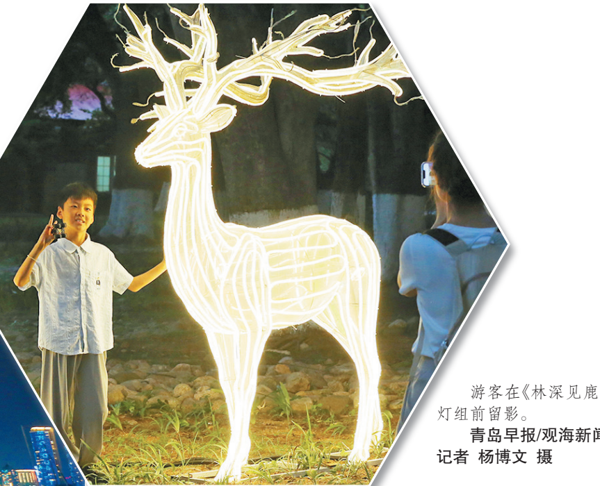
游客在《林深见鹿》灯组前留影。

但很多人不知道的是,制作这组灯组时,工作人员用废弃的玻璃瓶和上千个啤酒罐作为材料,通过创意,让整个灯组的制作环保低碳。市民和游客在游览时,如果看到《青岛啤酒》灯组,可以仔细观看,找一找玻璃瓶和啤酒罐在灯组的哪个部位。