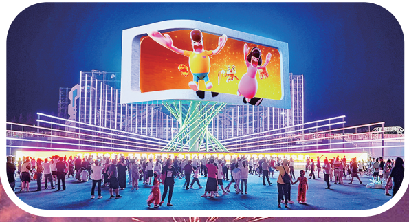
金沙滩啤酒城裸眼3D大屏。