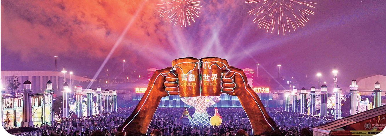
往届青岛国际啤酒节资料图。