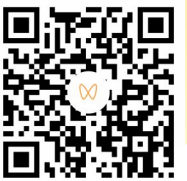
扫码观看相关视频