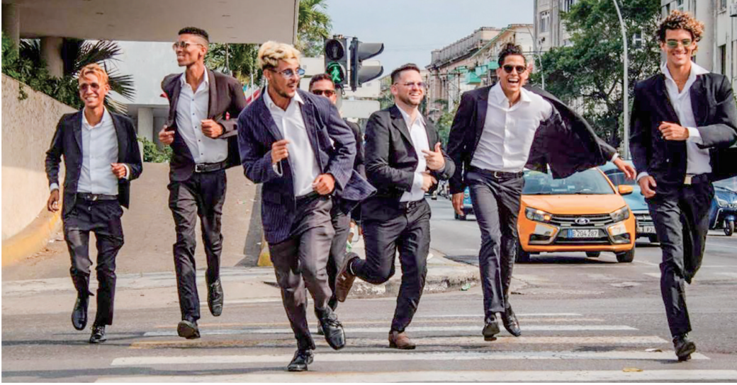
古巴“哈瓦那的偶像”演唱团将来青演出。