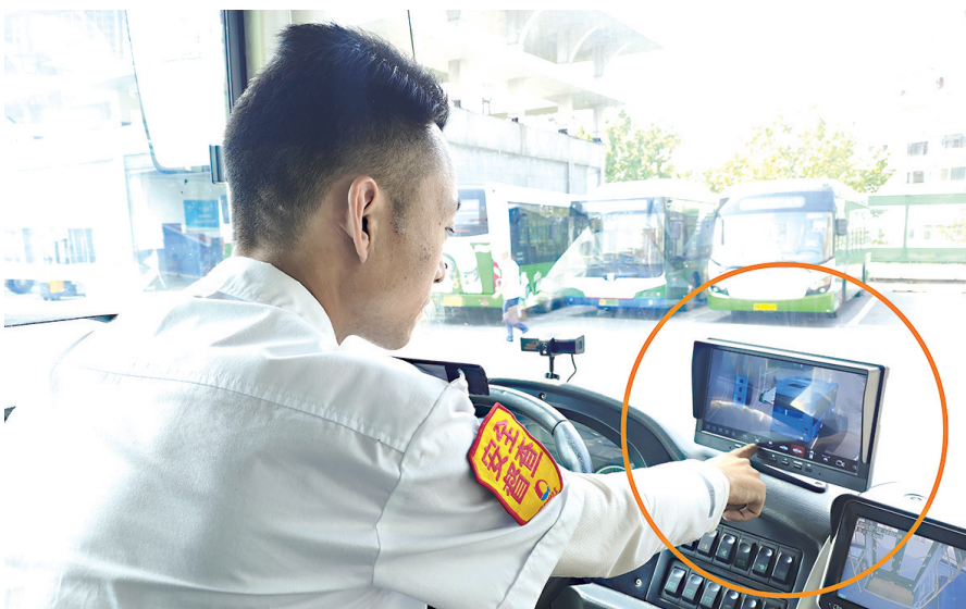
驾驶员使用公交车无盲区辅助驾驶系统。

从初期简易摄像头的安装测试，到与隧道巴士公司“公交维修联盟创客工作室”团队的深度合作，历经半个多月的反复调试，最终打造出一套自主研发的“公交车无盲区辅助驾驶系统”。通过在车身前、后、左、右安装4个高清摄像头，配合智能图像拼接技术，驾驶室内10寸显示屏可实时呈现车辆周边360度全景影像，将传统盲区转化为“透明可视区”，让驾驶员对车辆周围情况一目了然。