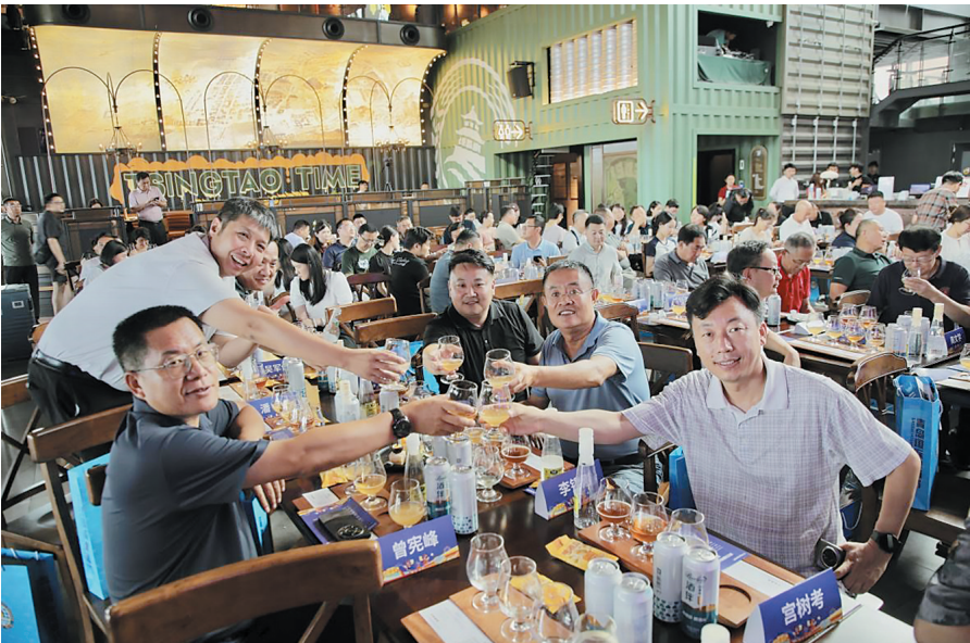
第35届青岛国际啤酒节推介会现场。