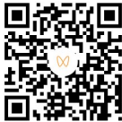
扫码观看相关视频 剪辑 记者 吴冰冰