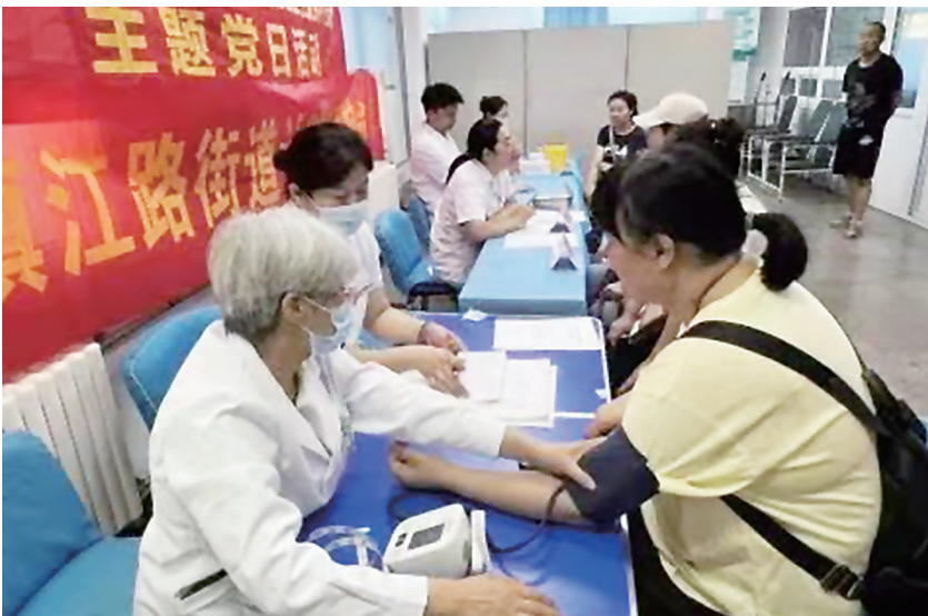
为居民开展健康义诊,免费测量血压。

炎炎夏日,在党建广场,一场“北卫先锋送健康 计生服务践初心”的便民大集正在如火如荼进行。海泊